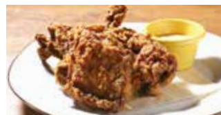
ハーブフライドチキン 二段熟成醤油&チーズソース