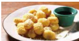
揚げニョッキ メイブルソース添え