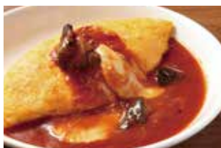
ナスとモッツアレラのミートソースオムライス