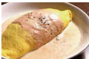
明太子クリームオムライス