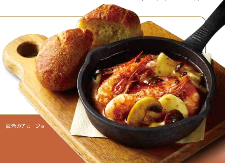
海老のアヒージョ