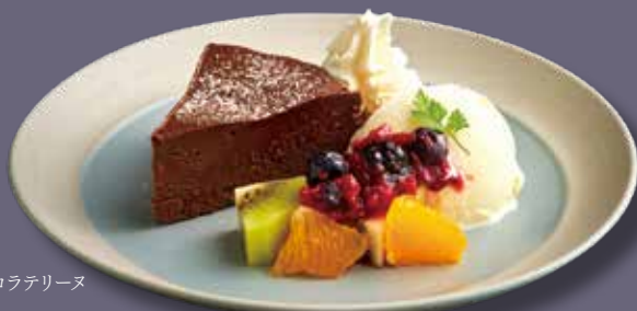
ショコラテリーヌ