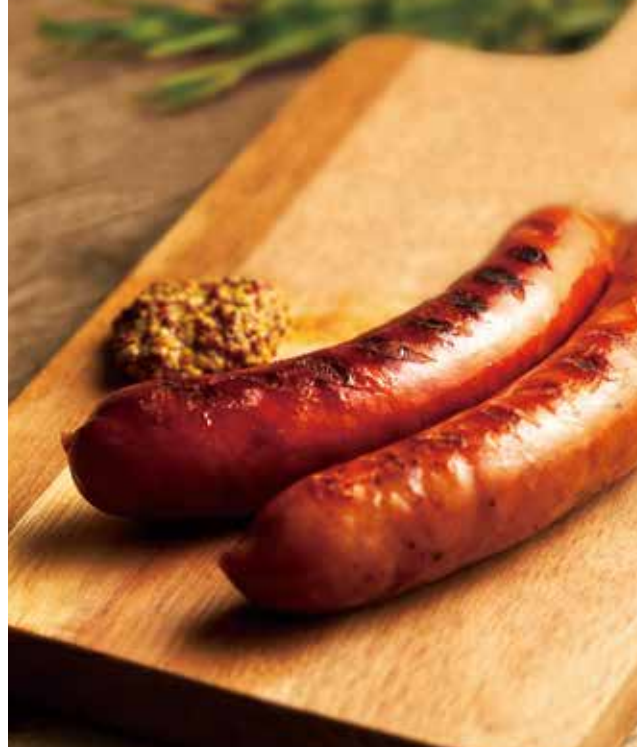
自家製ソーセージ