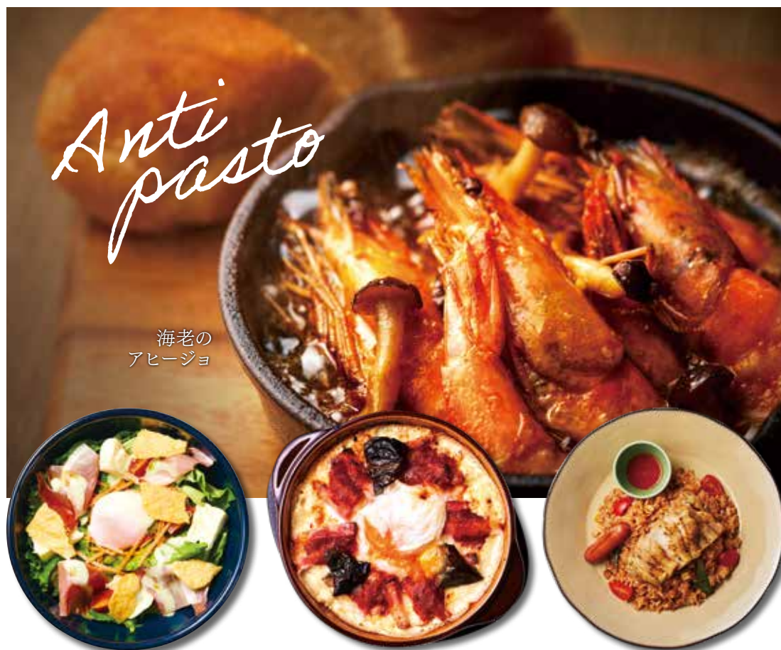
海老の アヒージョ