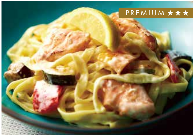
スモークサーモンと彩り野菜のレモンクリームソース