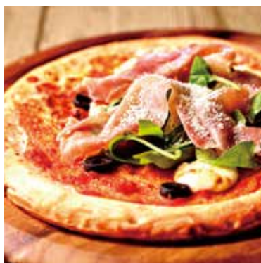
プロシュート マスカルポーネ