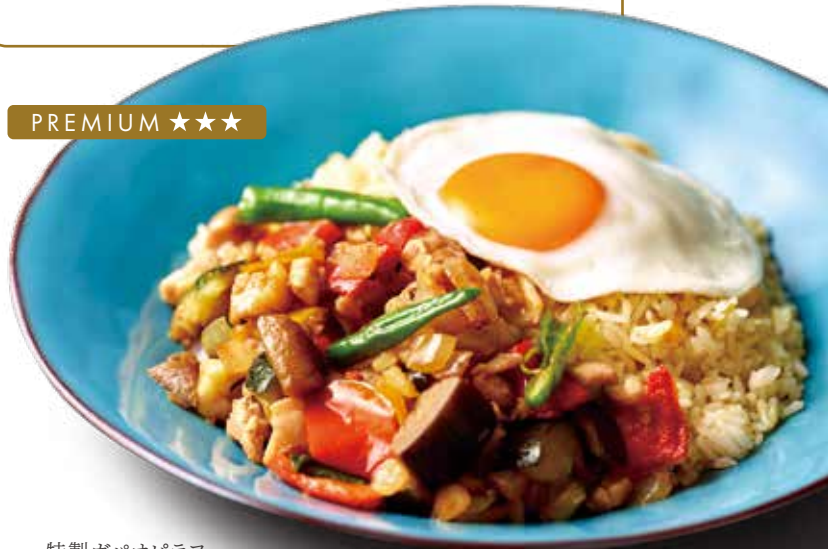
特製ガパオピラフ