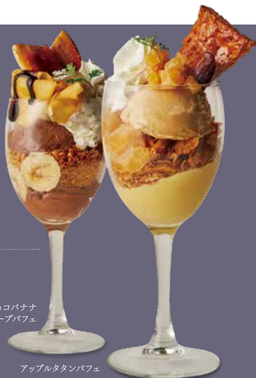
アップルタタンパフェ