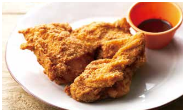
ハーブフライドチキン サテソース添え