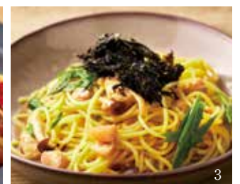
1.生ハムとキノコ、アスパラの地中海仕立てのペペロンチーノ / 2.ベーコンと彩り野菜のペペロンチーノ / 3.若鶏とキノコの柚子胡椒仕立ての和風ソース