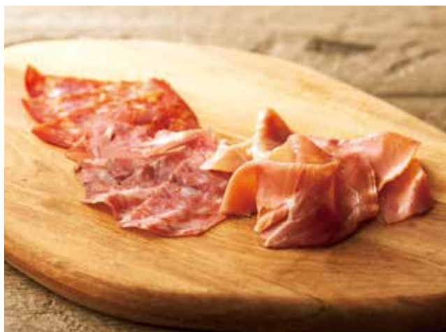
スペイン産熟成生ハムとサラミの盛り合わせ