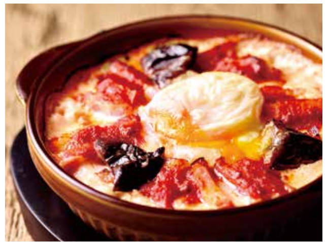
ナスとベーコン、温泉玉子のミートドリア