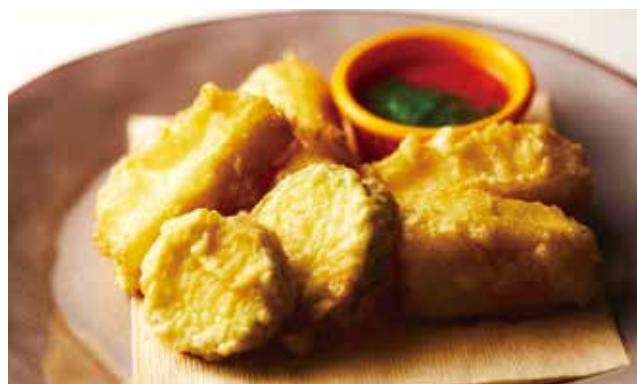
モッツアレラとズッキーニのフリット