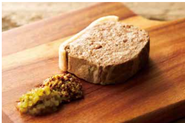
フランス産 パテ・ド・カンパーニュ

「田舎風パテ」という意味のフランスの家庭料理です。 肉類に香辛料、ハーブ類などで味をつけ、型に入れて焼き固めています。