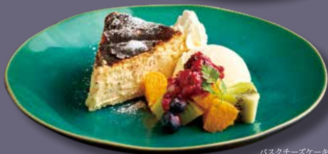
バスクチーズケーキ