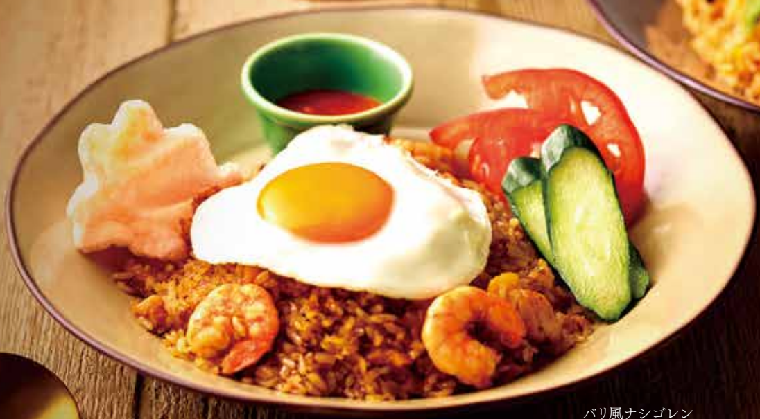
バリ風ナシゴレン