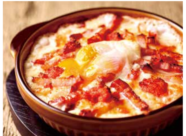
ベーコンと明太子、温泉玉子のカルボナーラドリア