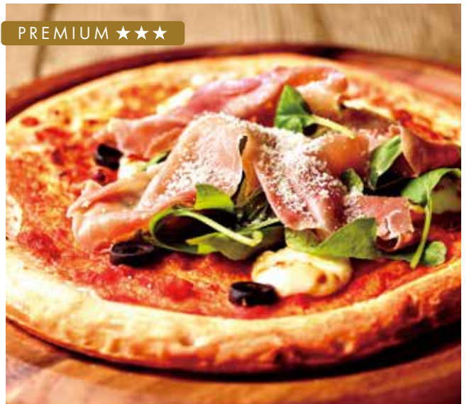
プロシュート マスカルポーネ