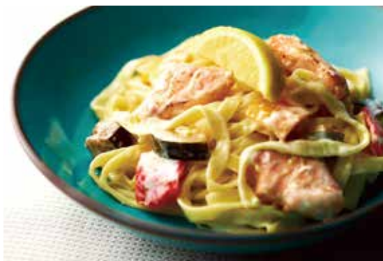
スモークサーモンと彩り野菜の レモンクリームソース