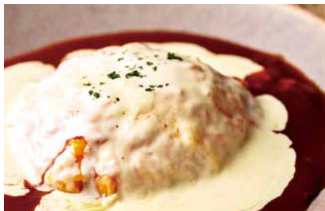
ふわふわ帽子とたっぷりマスカルポーネチーズオムライス