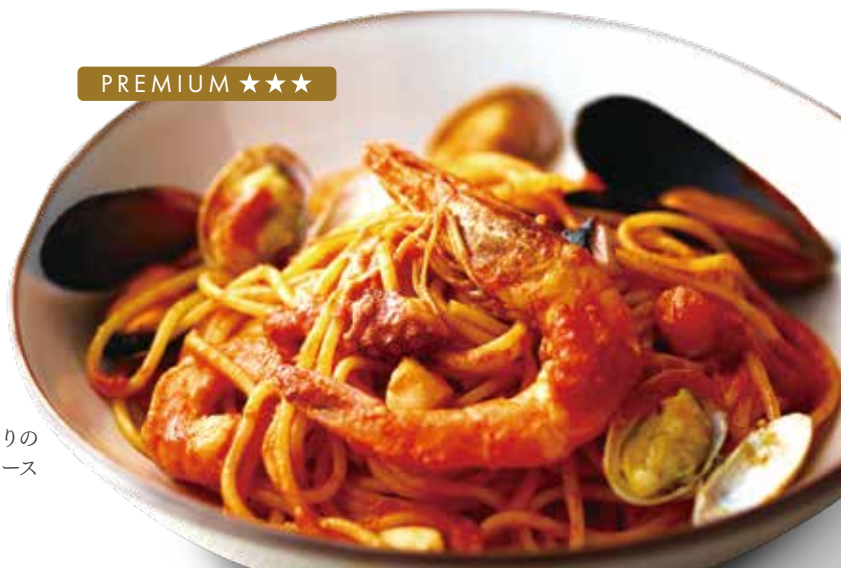
魚介たっぷりの ペスカトーレトマトソース