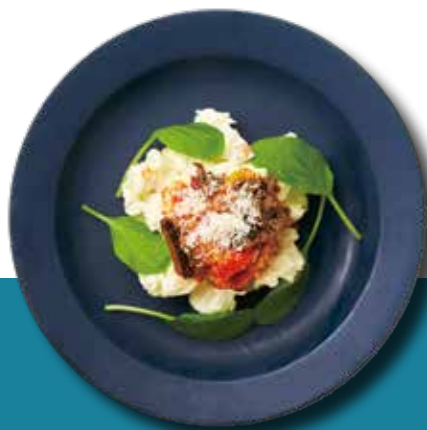
ポテトサラダ 野菜のトマトソース&タブナードソース