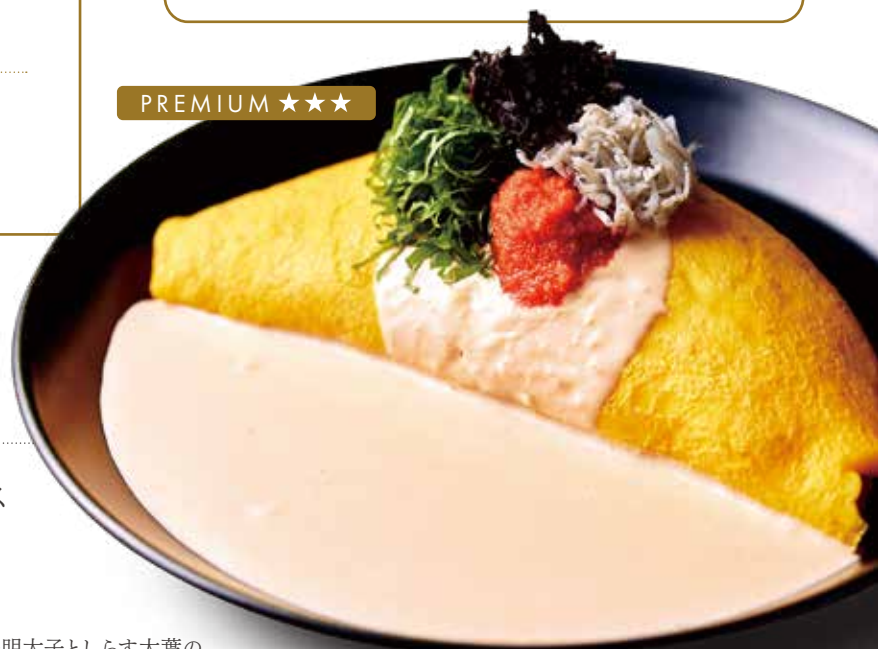
博多明太子としらす大葉の クリームオムライス