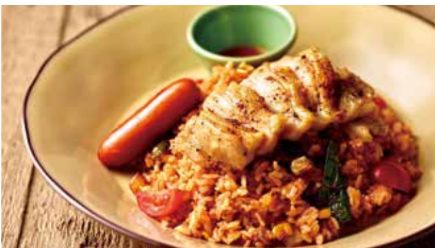
ケイジャンチキンとソーセージの特製ジャンバラヤ