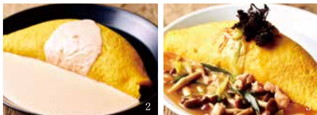
1.タコとしらす、大根おろしの博多明太子和風オムライス / 2.博多明太子クリームオムライス / 3.若鶏とキノコの柚子胡椒仕立ての和風オムライス