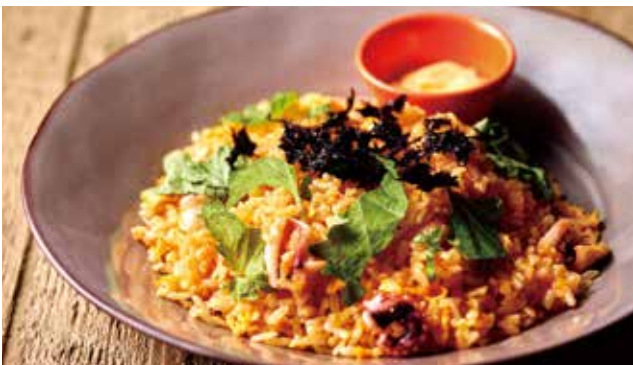
和風明太子大葉ピラフ