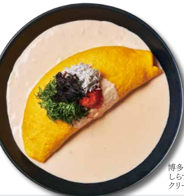
博多明太子と しらす大葉の クリームオムライス