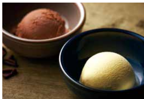
チョコアイス / バニラアイス