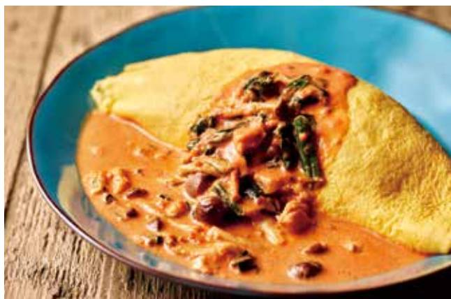
若鶏とキノコ、ほうれん草のトマトクリームオムライス