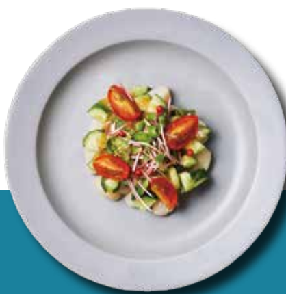
貝柱ときゅうりのタルタル